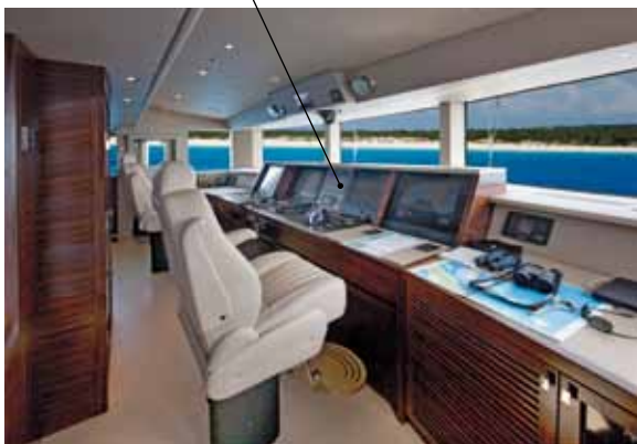
La plancia di comando, con due postazioni; la sala macchine sul tank deck/ The command bridge with two steering positions; the engine room on the tank deck

Although these yachts will all bear completely different names, they are sure to create their own private heaven on earth, in true Aldabra style! ⚙️