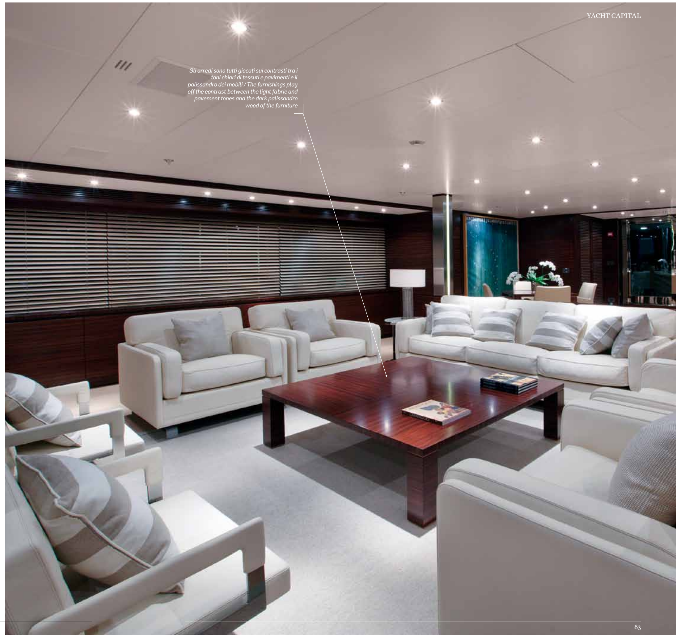
Gli arredi sono tutti giocati sui contrasti tra i toni chiari di tessuti e pavimenti e il palissandro dei mobili / The furnishings play off the contrast between the light fabric and pavement tones and the dark palissandro wood of the furniture

Ma la parte più magica, affascinante e inaspettata di questa barca, sono sicuramente gli interni e alcune scelte di layout. Luminosa come solo un Codecasa sa essere, Aldabra ha interni che contrappongono sapientemente il legno scuro di palissandro del mobilio e delle pareti, al legno di rovere, di tonalità molto chiara, impiegato per i pavimenti. Se a tutto questo si aggiungono i tessuti d'arredo e le pelli usate per alcune pareti, per le testate e i bordi dei letti che alternano il panna al color corda, la magia è completa. I bagni sono invece in marmo Statuario e in legno